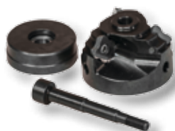
Obj. č. 27234