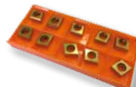
Obj. č. 27231