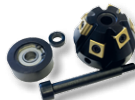
Obj. č. 27223