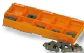
Obj. č. 26109