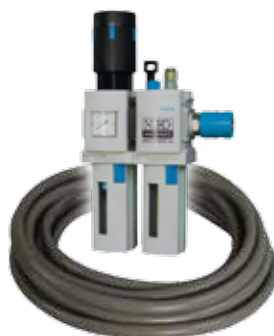
Obj. č. 27221