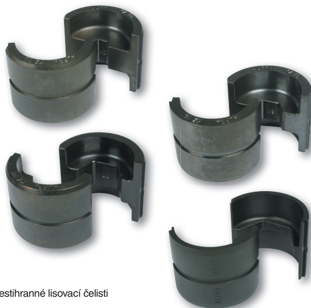
Šestihhranné lisovací čelisti