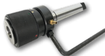
Obj. č. DJXK_50_MT3