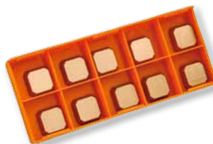
Obj. č. 25909