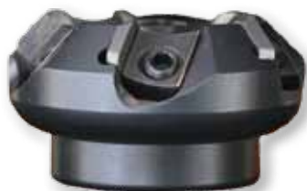
Obj. č. 28221